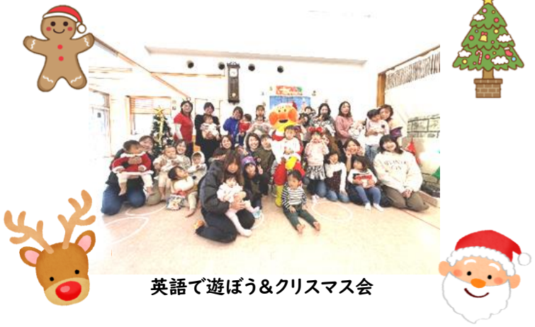
英語で遊ぼう&クリスマス会