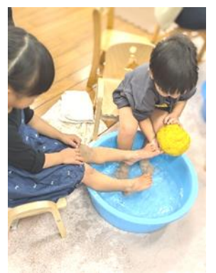
つばさ館温泉(ゆず湯)